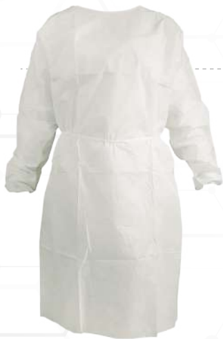
AVENTAL PROC ESPECIAL (GRAMATURA: 16g/m 2 )