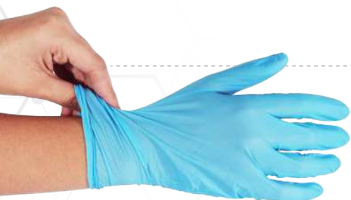
LUVA NITRÍLICA SEM PÓ - AZUL